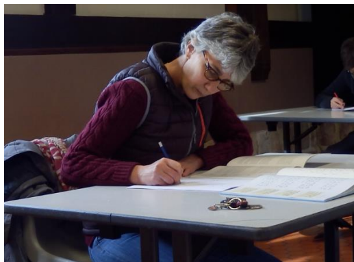
2 - On s'essaie au crayon sur un brouillon...