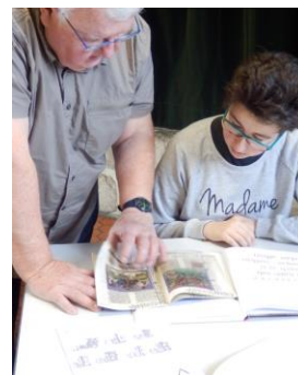
.... avec conseils personnalisés