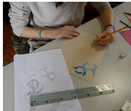
3 - Et on se lance sur la feuille dont on a choisi la couleur, toujours au crayon.