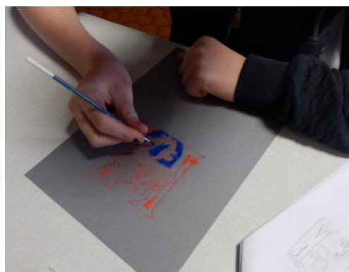
5 - On passe au pinceau et à la gouache