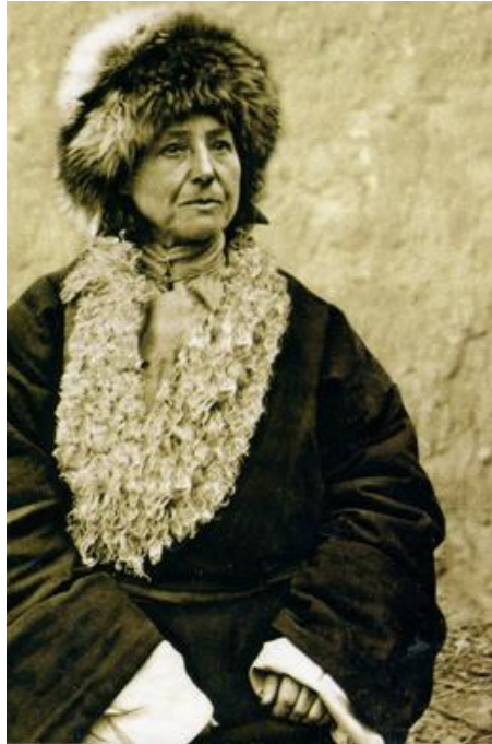
Photographie d'Alexandra David-Néel au Tibet

Grande exploratrice, femme libre, aux convictions affirmées