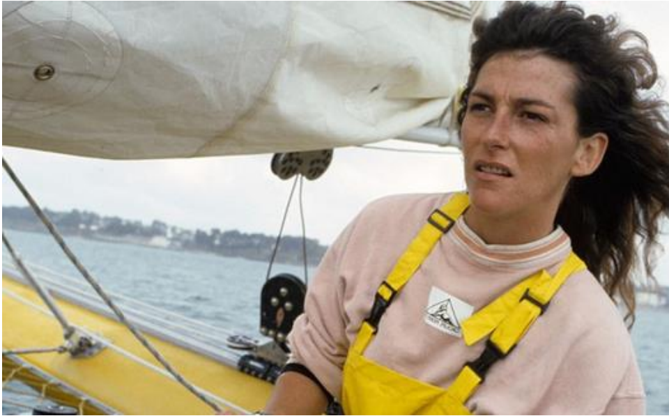
Photographie de Florence Arthaud

Femme charismatique au caractère bien trempé et au franc-parler légendaire.