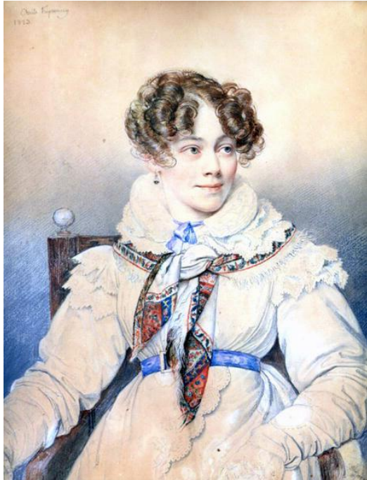
Portrait de la comtesse de Ségur en 1823, par Orest Kiprensky

Femme au caractère fait de hauteur et de fermeté d'âme, d'aménité naturelle et d'enjouement malicieux.