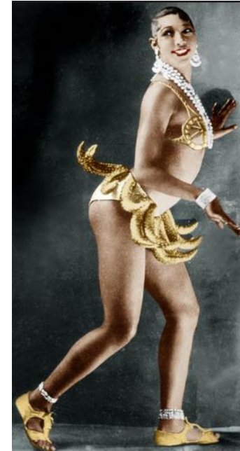
Josephine Baker in Banana Skirt from the Folies Bergère, production « Un Vent de Folie » en 1927

La plus parisienne des américaines, la plus sulfureuse des danseuses de music-hall, la plus grimaçante des icônes.