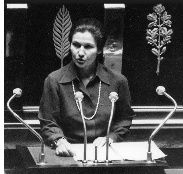
Simone Veil défendant sa loi sur l'avortement à l'Assemblée nationale

Simone Veil est née le 13 juillet 1927 à Nice dans une famille juive non pratiquante. Arrêtée avec sa famille par la Gestapo en 1944, elle est alors transférée dans différents camps dont Auschwitz et Bergen-Belsen.