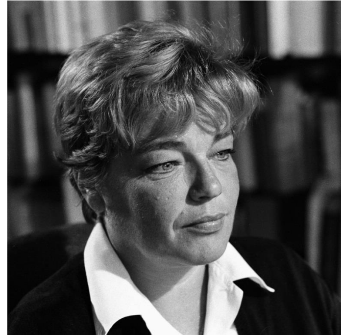
Photographie de Simone Signoret (date : ??)

Simone Signoret, de son vrai nom Simone Kaminker, est née en 1921 à Wiesbaden en Allemagne et est morte en 1985. Prix d'interprétation féminine au Festival de Cannes 1959 pour son rôle dans Les Chemins de la haute ville , elle est la 2 nd e actrice française à remporter l'Oscar de la meilleure actrice l'année suivante pour ce même film. En 1977, elle reçoit le César de la meilleure actrice pour La Vie devant soi d'après le roman éponyme de Romain Gary. Mariée de 1948 à 1951 au réalisateur Yves Allégret puis de 1951 à sa mort à l'acteur et chanteur Yves Montand, elle fait preuve d'une forte personnalité et s'exprime sans contraintes. Sa verve sert ses convictions. Si sa conscience politique s'affirme dès 1941, le couple Montand-Signoret affichera un humanisme de gauche, combattant toutes les oppressions.