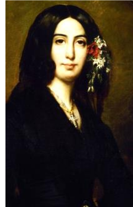
Portrait de George Sand en 1838 par Auguste Charpentier