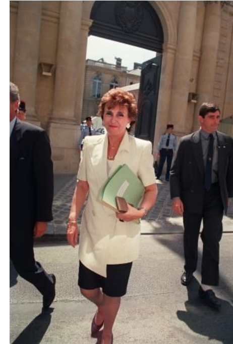
Edith Cresson devant Matignon

Unique femme à avoir été Premier ministre en France.