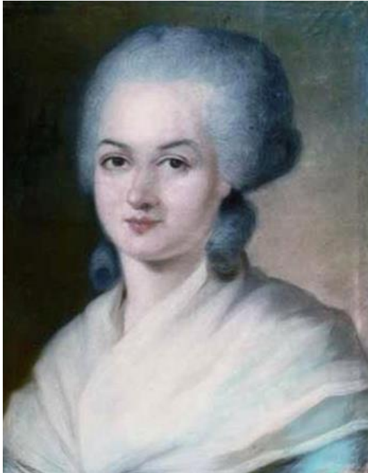
Portrait d'Olympe de Gouges par Alexandre Kucharski (entre 1770 et 1788)

Marie Gouze, dite Olympe de Gouges, est née à Montauban le 7 mai 1748 et est morte guillotinée à Paris le 3 novembre 1793.