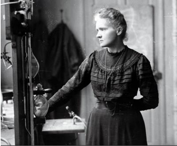
Marie Curie dans le laboratoire de la rue Cuvier, vers 1913.

Militante déterminée en faveur des recherches scientifiques et de la coopération intellectuelle internationale.