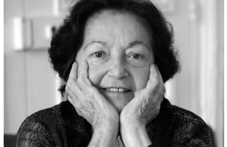
Photographie de Françoise Héritier (personnelle)

Femme engagée, grande figure du féminisme