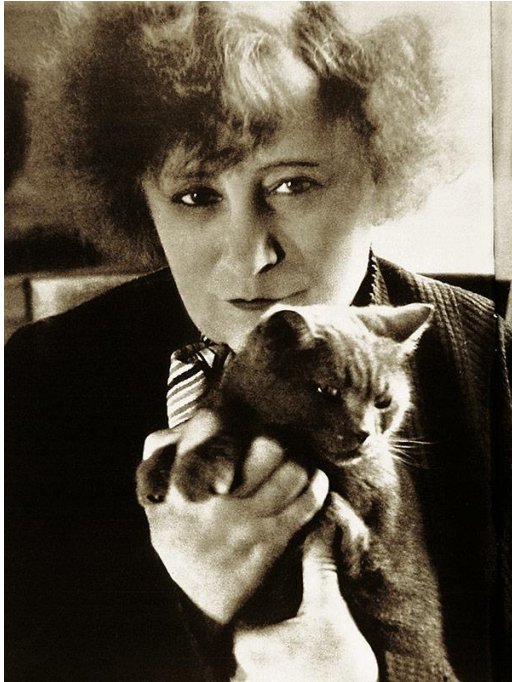
Photographie de Colette et de « Chatte dernière » en 1933

Merveilleuse conteuse d'histoires, talentueuse et scandaleuse.