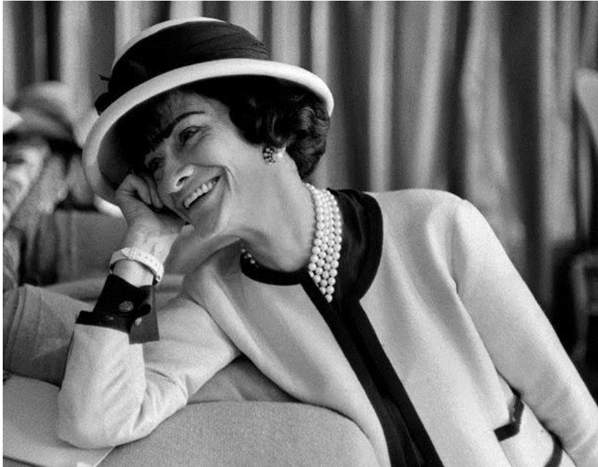
Photographie de Coco Chanel par Douglas Kirkland

Travail, âpreté, rigueur, extravagance, indépendance.