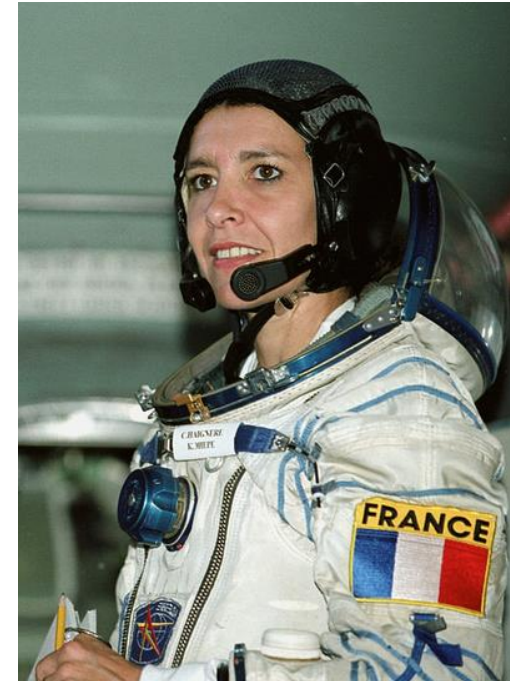
Portrait de la spationaute Claudie Haigneré en scaphandre (2001)

Claudie Haigneré, née André-Deshays, fait des études de médecine et se spécialise en médecine du sport, de l'aéronautique et en rhumatologie, décrochant un doctorat en neurosciences. Elle devient chercheur au laboratoire neurosensoriel du CNRS puis responsable de la médecine spatiale au CNES.