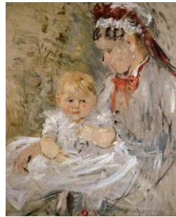
Tableau peint par Berthe Morisot (1880)