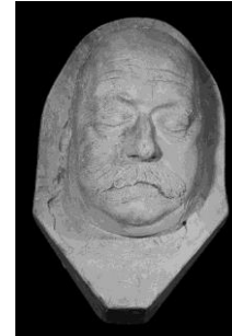
Masque mortuaire de Gustave Flaubert