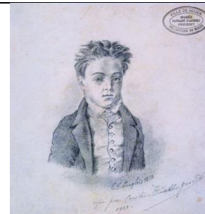
Gustave Flaubert Dessin au crayon de E.S. Langlois 1838