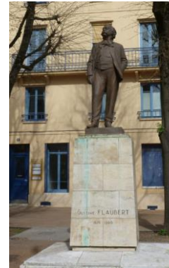
Statue de Gustave Flaubert, Place des Carmes, Rouen