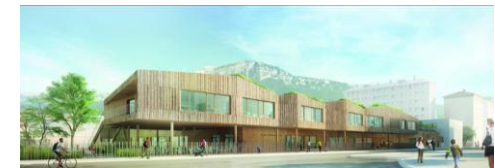
Grenoble, écoquartier Flaubert Projet pour la nouvelle école Gustave Flaubert

Le salambo est le gâteau imaginé par un pâtissier de l'époque de Flaubert, en hommage à son roman Salammbô .