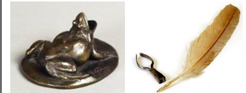
Encrier grenouille de Gustave Flaubert Plume d'oie et taille plume

1857/1862 : Après cinq ans de travail et un voyage en Tunisie afin de se documenter et de voir Carthage, parution du roman historique Salammbô