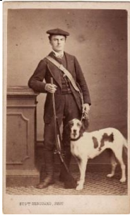
Guy de Maupassant à 20 ans en tenue de chasse