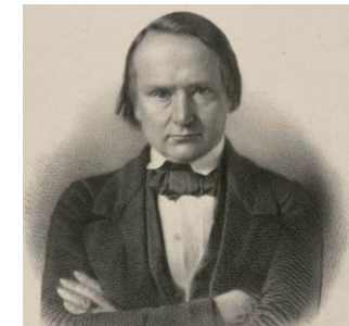
Lithographie de Victor Hugo, 1849