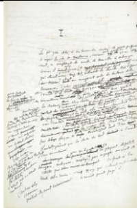
Une page du manuscrit de L'Éducation sentimentale