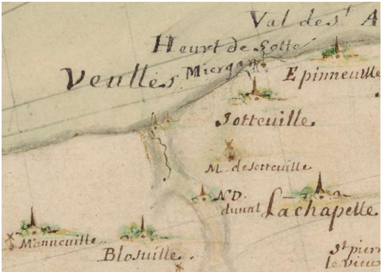
BNF, Cartes et plans, GESH18PF33P15, Plan géométrique de Cayeux à Isigny Nicolas Magin, 1699 (détail)