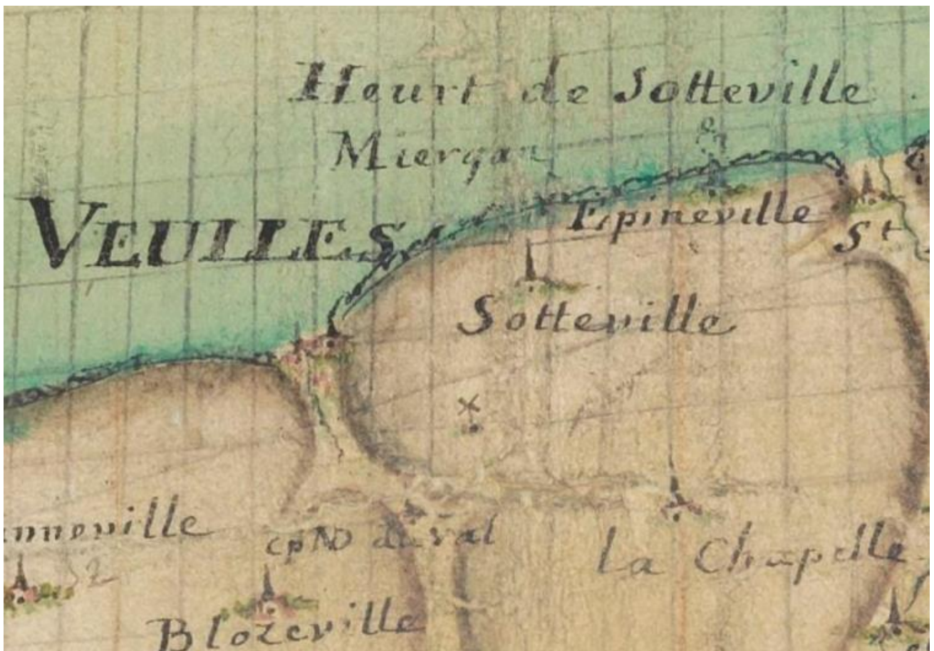
BNF, Cartes et plans, GESH18PF33P16, Plan géométrique de Cayeux à Isigny Nicolas Magin, fin XVIIe-début XVIIIe siècle (détail)