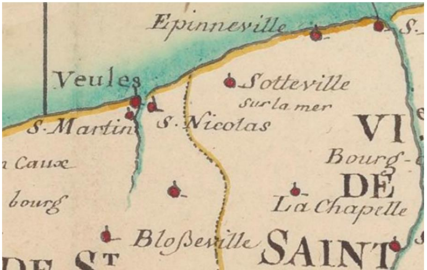
BNF, Cartes et plans, GESH18PF33P11-1D, M. Lemoine, 1740 (détail) Carte d'une partie des côtes de Normandie (Yport-Le Tréport)