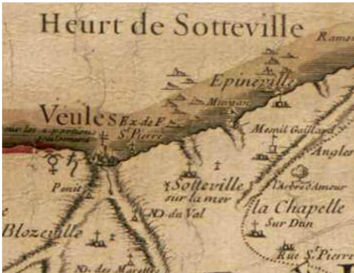
ADSM, 12 Fi 216, Carte particulière du Diocèse de Rouen, M. Berey, 1715 (détail)