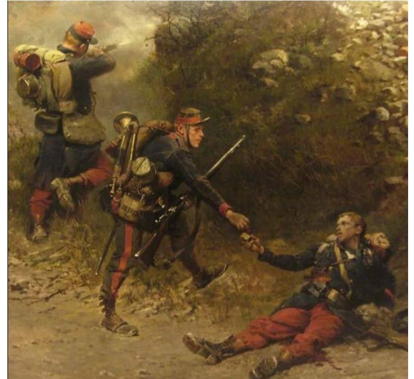
Le fond de la giberne (Panorama de Champigny), Detaille et Neuville