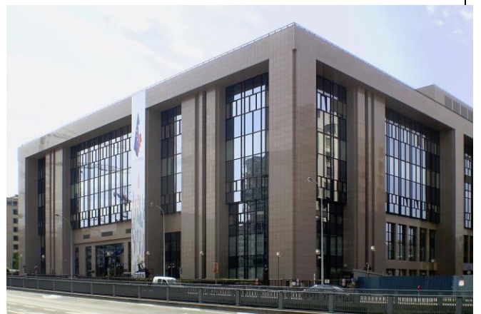
Le Juste Lipse à Bruxelles

Le Conseil de l'Union européenne est chargé de la coordination générale des activités de l'Union. Il assure, avec le Parlement européen, la fonction législative et adopte le budget de l'Union. Il réunit les ministres compétents par domaine d'activité.